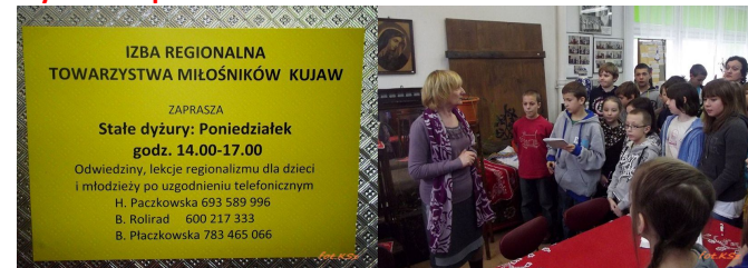
W Izbie Regionalnej

Doszlśmy do wniosku, że warto przypomnieć co z tym tematem się wiąże. To także przyczynek do działań TMK związanych z prowadzeniem kursów w tutejszej Izbie Regionalnej promujących i nawiązujących do dawnych tradycji hafciarskich tego rejonu. Stąd pomysł założenia strony internetowej poświęconej hafciarstwu.