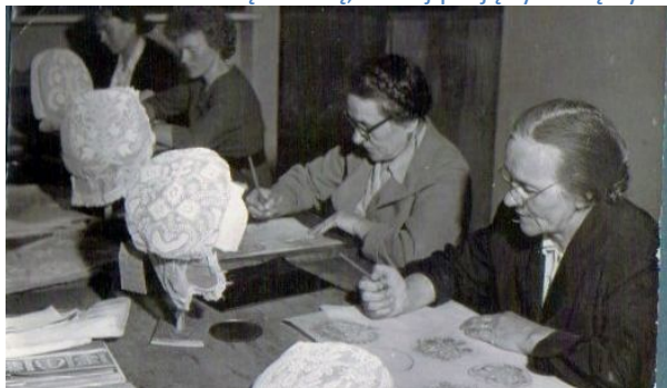
Na starej fotografii