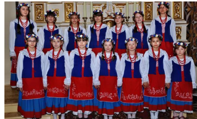
Asysta parafialna klasztoru w Radziejowie-fartuszki wykonane przez uczestniczki kursu

Towarzystwo Miłośników Kujaw jest stowarzyszeniem regionalnym, uczestniczącym w życiu kulturalnym i społecznym, działającym na rzecz rozwoju i upowszechniania kultury naszego regionu. Podtrzymuje tradycję narodową, regionalną, obywatelską i kulturalną. Dbą o zachowanie dóbr kultury i tradycji kujawskiej, wspiera dorobek twórców i artystów regionalnych. TMK powstało ok. 1962 r. z inicjatywy grupy radziejowian.